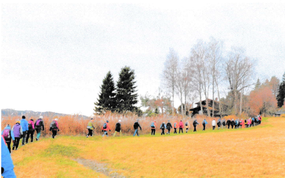
Seniorer på tur ved Rostad, Inderøy.

I 2023 var det 401 deltakere på de 12 turene som ble gjennomført, et gjennomsnitt på knapt 34.