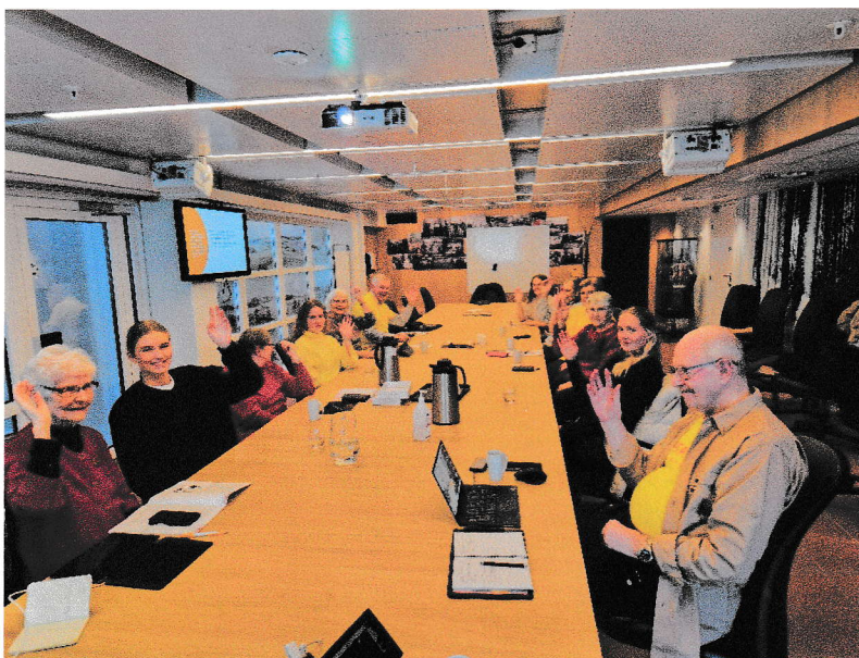
Datastue med deltakere, veiledere og digivennner fra Levanger vgs.

Markedsføring av Datastuer har vært gjennom omtale i lokale aviser, annonsering, foredrag i ulike foreninger og ikke minst – direkte oppsøking og en positiv ryktebørs.