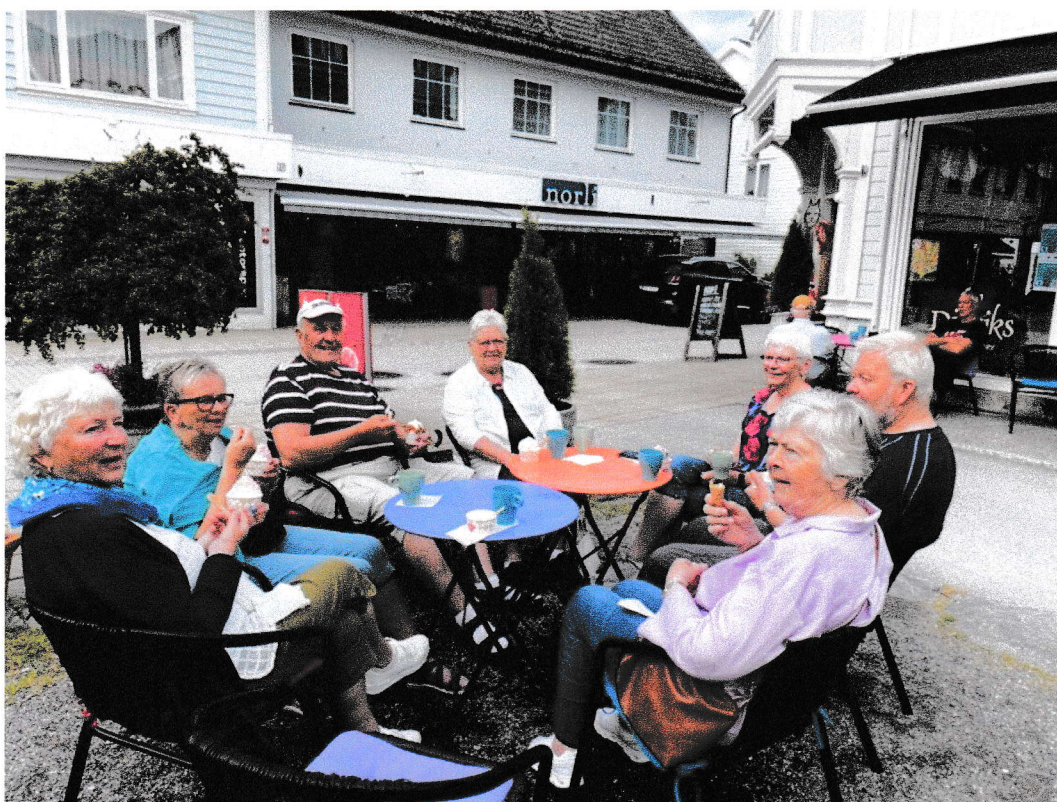
Trivsel i Nordfjordeid.