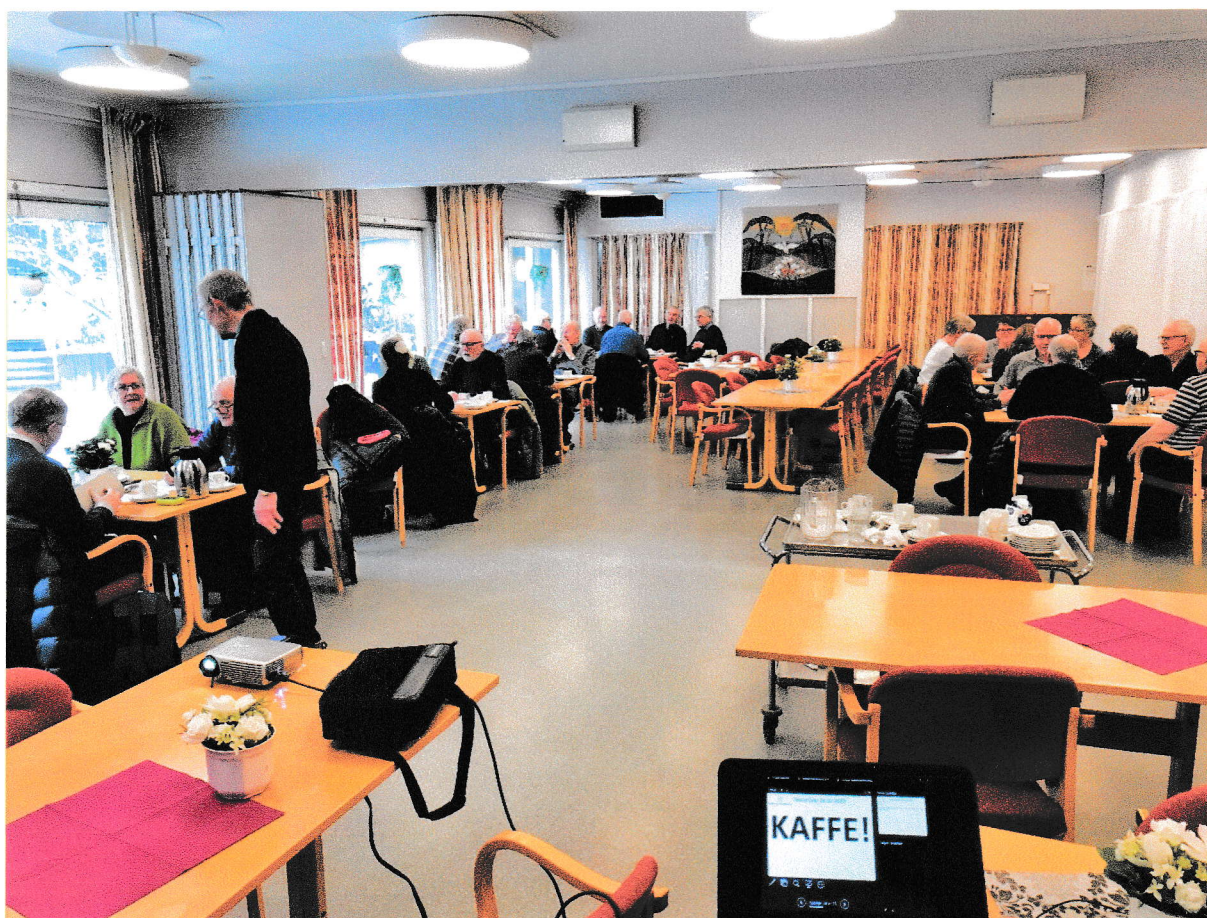
Kaffe og quiz hører sammen.

I oktober ble det holdt kurs over fire dager i å lage fotobok, med Kjetil Vatn som instruktør.